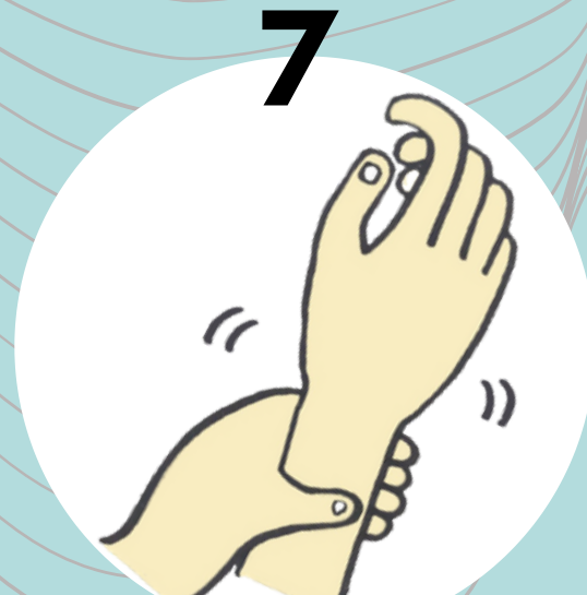
7 ถูรอบข้อมือ