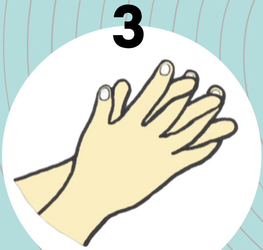
3 ฝ่ามือถูฝ่ามือ และนิ้วถูซอกนิ้ว