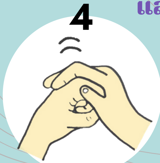
4 หลังนิ้วถูฝ่ามือ