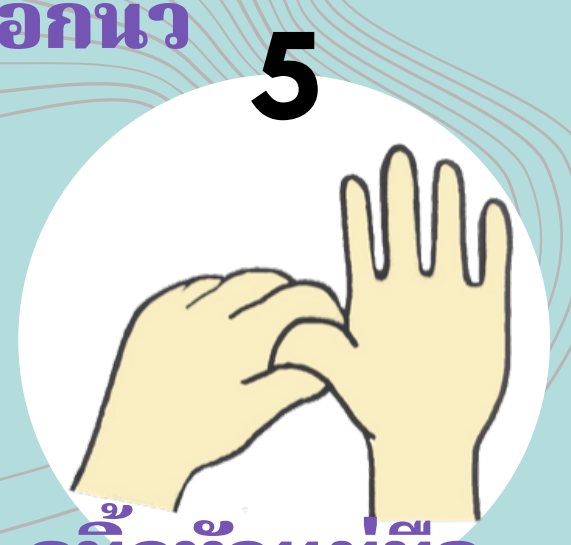
5 ถูนิ้วหัวแม่มือ โดยรอบด้วยฝ่ามือ