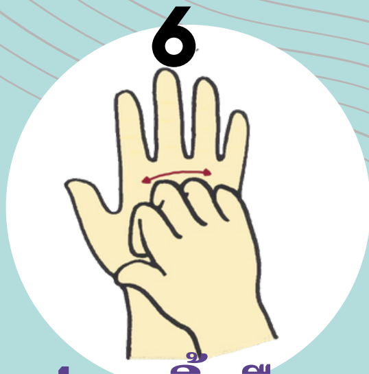
6 ปลายนิ้วมือถู ขวางฝ่ามือ