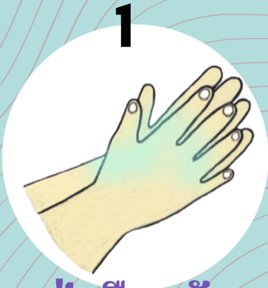
1 ฝ่ามือถูกัน