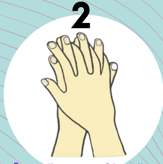
2 ฝ่ามือถูหลังมือ และนิ้วถูซอกนิ้ว